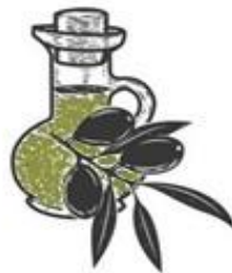
Oli d'oliva verge extra . Fruit de les nostres oliveres centenàries