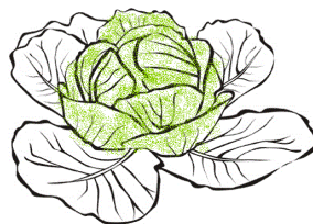
Productes frescos i orgànics de l'hort